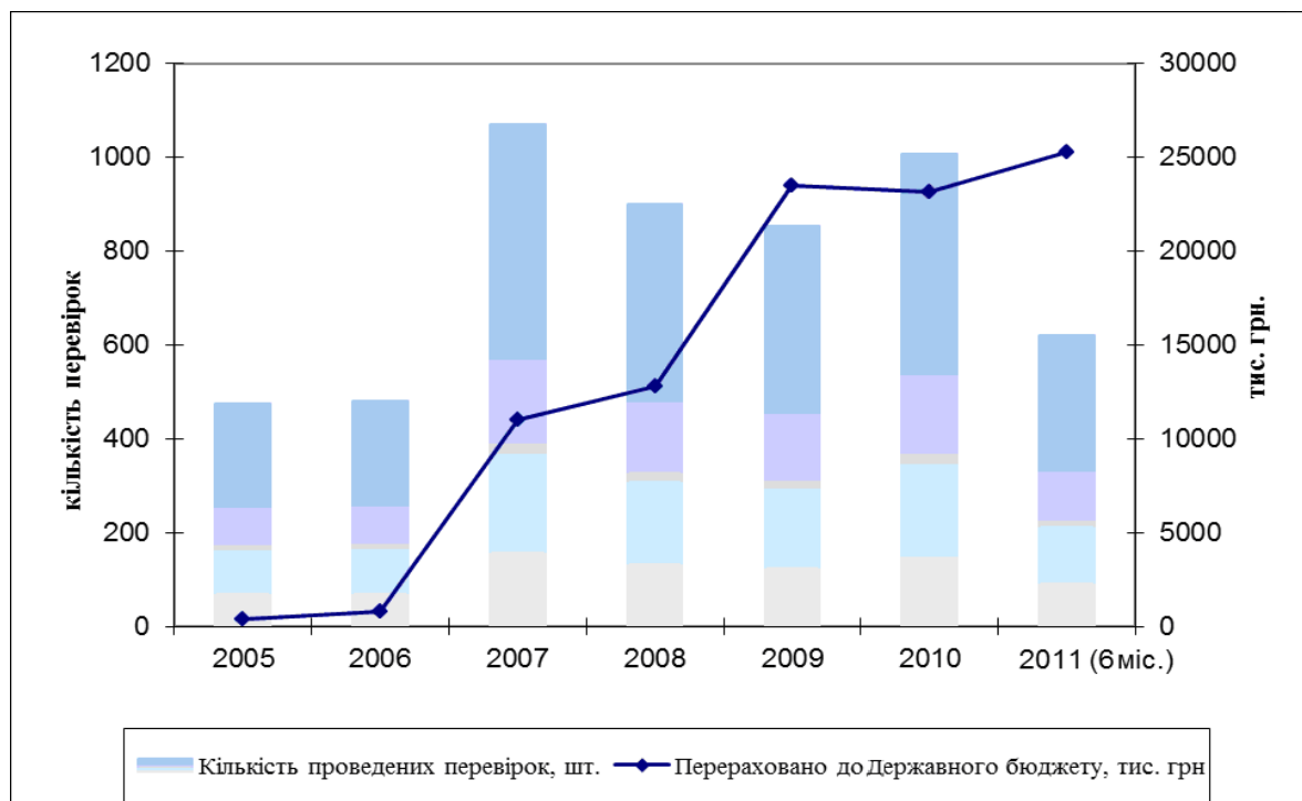
Рис. 3. Результати контрольно-перевірочної роботи Державної митної служби України за 2005–2011 рр. [складено автором за даними ДМСУ]

є найбільшим ризиком у вигляді недотримання законодавства. Інструмент проведення митного постаудиту в Україні – документальна перевірка. На рис. 3 подано результати контрольно-перевірочної роботи митних органів України.