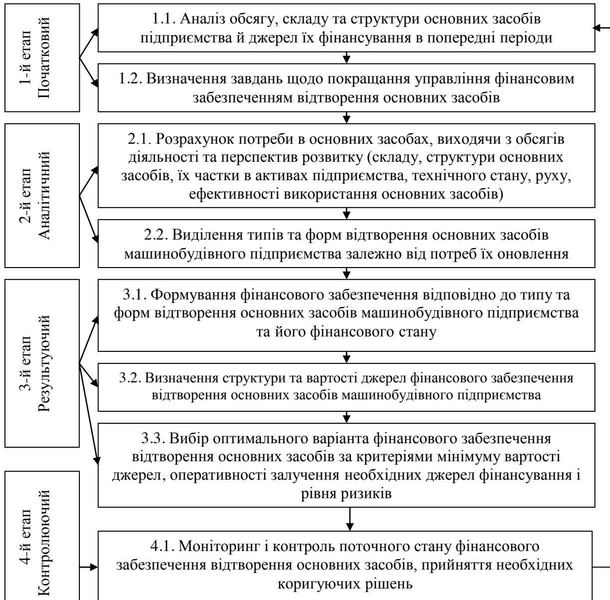
Рис. 1. Послідовність процесів управління фінансовим забезпеченням відтворення основних засобів машинобудівних підприємств

Для забезпечення машинобудівного підприємства в достатньому обсязі основними засобами, особливо активної їх частини, а також досягнення розумного зіставлення джерел формування фінансових ресурсів та фінансової незалежності з урахуванням можливості ризикової ситуації в роботі сформовано послідовність процесів управління фінансовим забезпеченням відтворення основних засобів машинобудівних підприємств (рис. 1).