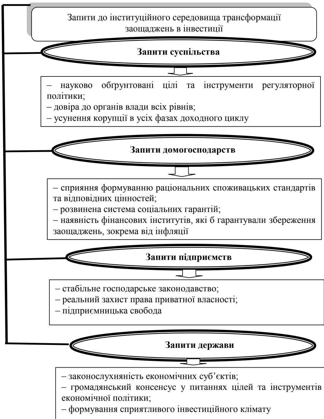
Рис. 2. Запити груп економічних суб'єктів до інституційного середовища трансформації заощаджень в інвестиції

У свою чергу, це підвищить надходження заощаджень до фінансових інституцій (гарантування вкладів фізичних осіб до інститутів спільного інвестування та реальний запуск другого й третього етапів пенсійної реформи), а також сприятиме заохоченню інвестиційної діяльності бізнесу (вивільнення від оподаткування лише тієї частини амортизаційних відрахувань, яка реально використовується на інвестиції, а не на споживання).