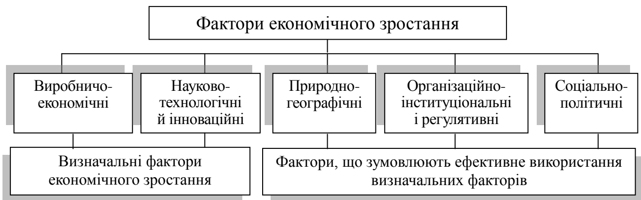
Рис. 1. Фактори економічного зростання національної економіки

Встановлено, що економічне зростання національної економіки зумовлено впливом і взаємодією взаємопов'язаних між собою факторів. Виходячи з особливостей сучасного економічного розвитку, систематизовано фактори економічного зростання національної економіки (рис. 1).