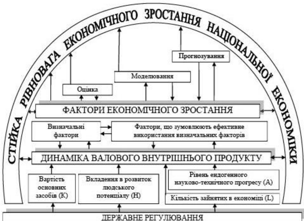
Рис. 2. Концептуальна схема дій щодо досягнення стійкої рівноваги економічного зростання національної економіки

У роботі сформовано концептуальну схему дій щодо досягнення стійкої рівноваги економічного зростання національної економіки (рис. 2).