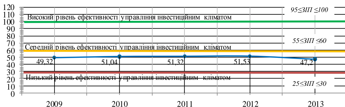
Рис. 3. Загальний інтегральний показник інвестиційного клімату в національній економіці за період 2009 – 2013 рр.

Факторна модель ґрунтується на оцінці факторів управління інвестиційним кліматом та забезпечує його оцінку за шкалою: сприятливий, сприятливий з помірним ризиком, з високим ризиком, несприятливий.