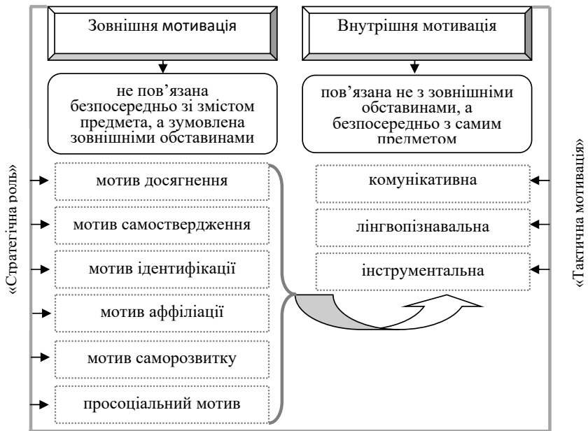
Рис. 1. Види мотивації

числі в процесі вивчення іноземної мови); мотив самоствердження (студенти прагнуть самоствердитися, отримати визнання інших, вивчають іноземну мову з метою отримання певного статусу в суспільстві); мотив ідентифікації (прагнення суб'єкта навчання бути схожим на іншого, наприклад, студент вчить іноземну мову, щоб зрозуміти тексти улюблених пісень); мотив аффіліації (прагнення особистості до спілкування з іншими, іноземну мову вивчає з метою спілкування з друзями-іноземцями); мотив саморозвитку (прагнення до самовдосконалення; іноземна мова слугує засобом задля духовного збагачення і загального соціокультурного розвитку особистості); просоціальний мотив (пов'язаний з усвідомленням суспільного значення діяльності; особистість усвідомлює соціальну значущість навчання, тому вивчає іноземну мову.