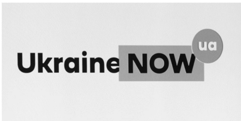
Рис. 1. Єдиний бренд України «Ukraine NOW UA» («Україна ЗАРАЗ»)

Бренд України, який історично сформувався ще у радянські часи, позиціонував країну як «житницю» територій соціалістичного табору. Ця асоціація визначала й маркери використання і сприйняття України, апелювання до неї світової спільноти. Така традиція зумовлювала й споживацьке ставлення до України і, як наслідок, формування таких кліше, як «сировинна база», «придаток» тощо. Новий логотип і його презентація свідчить про те, що бренд розроблявся для іноземної аудиторії. У її уяві мала виникнути нова візуалізація України без усталеного символічного сприйняття (соняшники, орнаменти, лани тощо). Враховуючи, що змістовна частина бренду, тобто описова частина закладених сенсів, не була розкрита, припускаємо, що первинна мета – закріпити Україну у порядку денному міжнародної спільноти.