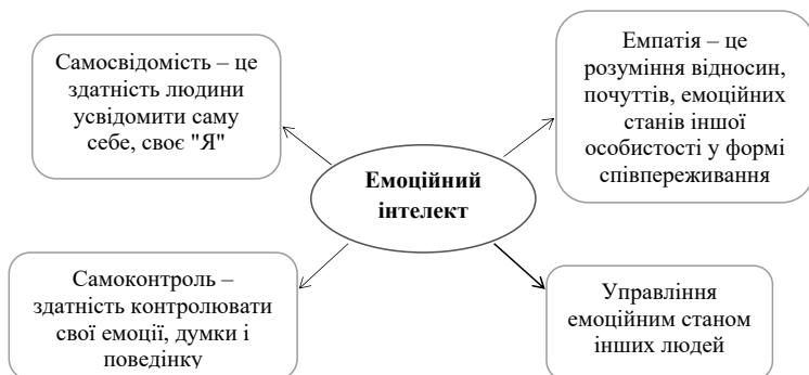
Рис. 1. Структура емоційного інтелекту

Структуру емоційного інтелекту складає здатність до емпатії, самосвідомість, самоконтроль та вміння управляти емоційним станом інших (рис. 1).