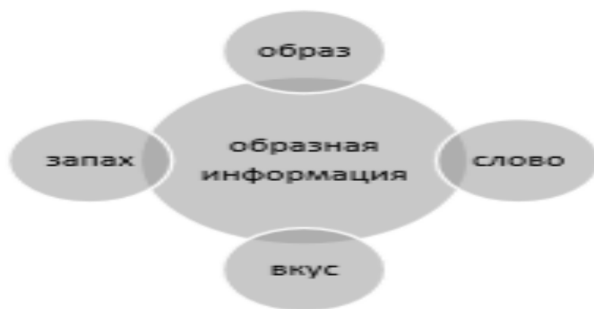
Рис. 1. Компоненты образной информации

вой информации, способностей к чтению и письму, запоминанию фактов, имен, дат. Поэтому, при выборе методик и подборе учебного материала, целесообразна дифференциация обучающихся на две группы с учетом вышеупомянутых особенностей. В следствии этого в работе с леворукими обучающимися следует принимать во внимание конкретные особенности выработки у них учебных способностей, в первую очередь способностей письма. Данные различных исследований показали, что мозг человека имеет свойство запоминать только связи. Другая информация производится по зафиксированным ранее связям. Однако, они образуются между зрительными образами или между сигналами анализаторных систем (Рисунок 1). Данный тип информации называется «образный», при котором связи фиксируются правильно, и она запоминается на долгое время. В контрасте с образной информацией, речевая и знаковая - частично формирует образы и лишь в незначительной степени фиксируется в памяти при условии специального длительного заучивания. В связи с этим, наиболее эффективным приемом изучения иностранного языка является интерактивная форма обучения.