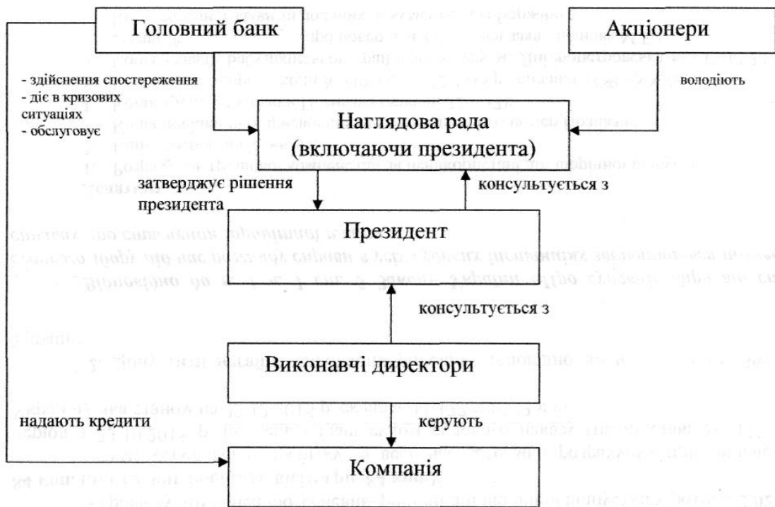
Рис. 5.2. Японська модель корпоративного управління