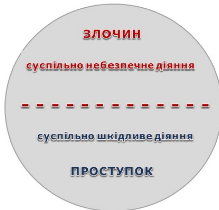
Рис. 7.1. Поділ правопорушення ( delictum ) на злочин і проступок за ознакою суспільної небезпеки

У римському праві юристи виділяли особливу групу деліктів – квазіделікти. Це ненавмисне позадоговірне правопорушення, заподіяння кому-небудь шкоди без умислу (або навіть можливості заподіяння такої шкоди), у результаті недбалості або необережності, що характеризується при цьому відсутністю визначеності винної особи. Наприклад, коли виставлений на підвіконні горщик впав (або міг впасти) і причинив шкоду особі або майну.