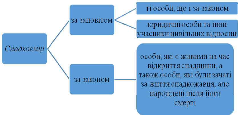
Рис. 4.2. Види спадкоємців

Спадщина (спадкова маса, спадкове майно) – це всі права та обов’язки, які належали спадкодавцеві на момент відкриття спадщини і не припинилися внаслідок його смерті.